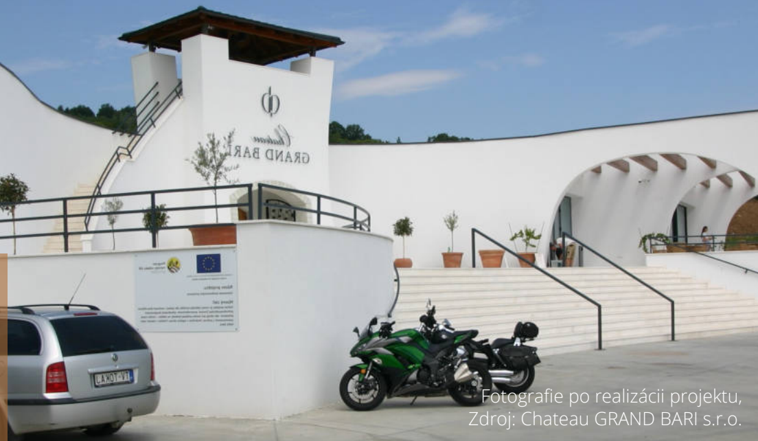
Fotografie po realizácii projektu, Zdroj: Chateau GRAND BARI s.r.o.

Schválená výška príspevku z PRV SR 2014 - 2020 : 1 619 989,14 €