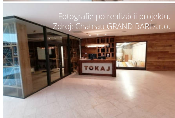
Fotografie po realizácii projektu, Zdroj: Chateau GRAND BARI s.r.o.