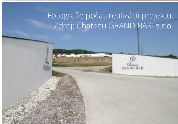
Fotografie počas realizácii projektu, Zdroj: Chateau GRAND BARI s.r.o.

Cieľom projektu je rozvoj vidieckej turistiky ako jednej z možností diverzifikácie poľnohospodárskej činnosti prostredníctvom vybudovania kongresových priestorov ako zdroja pre tvorbu pridanej hodnoty na vidieku - tvorbu novej zamestnanosti a príjmov, konkrétne v regióne okresu Trebišov v katastri obce Veľká Bara