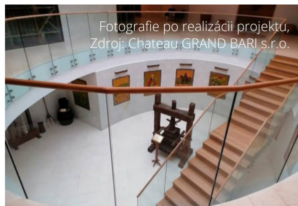
Fotografie po realizácii projektu