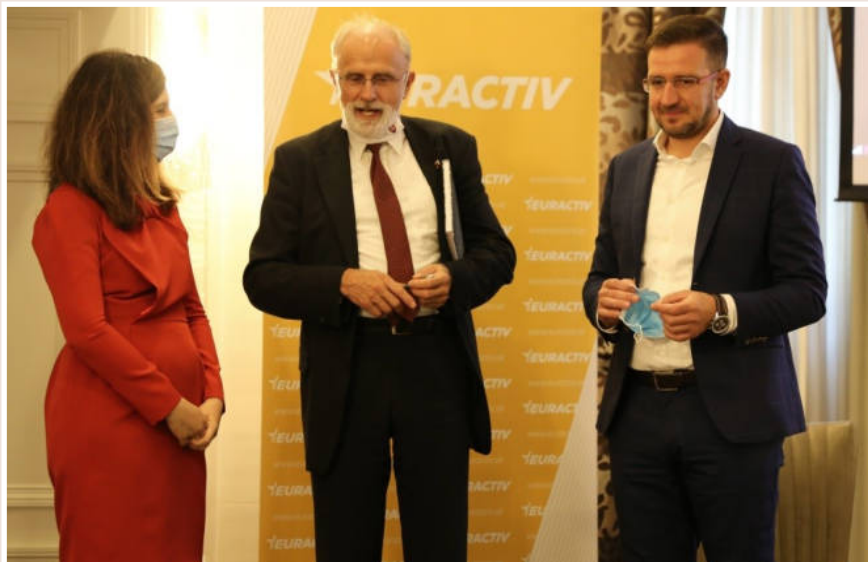
Foto: Minister Ján Mičovský diskutoval o Strategickom pláne na najbližších sedem rokov