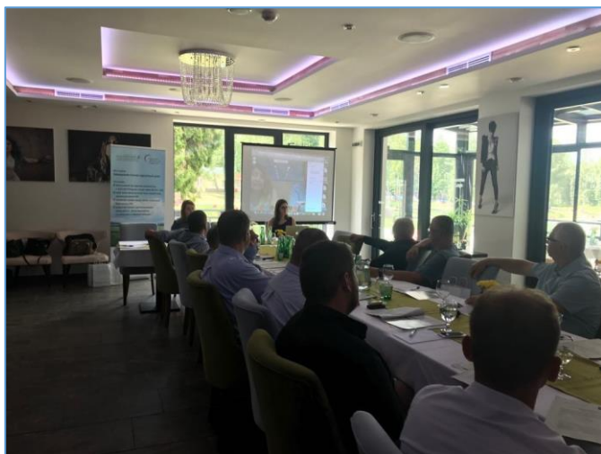
Videokonferencia so zástupcami MPRV SR.

MEDIINVEST Consulting, s.r.o., Mukačevská 14420/30, 080 01 Prešov +421 948 635 525; antenapresov@mediinvest.sk; www.mediinvest.sk/regionalna-antena