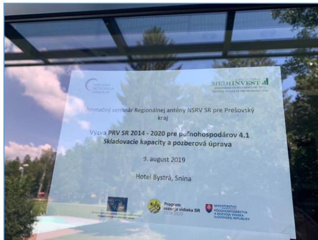
Prvky publicity.