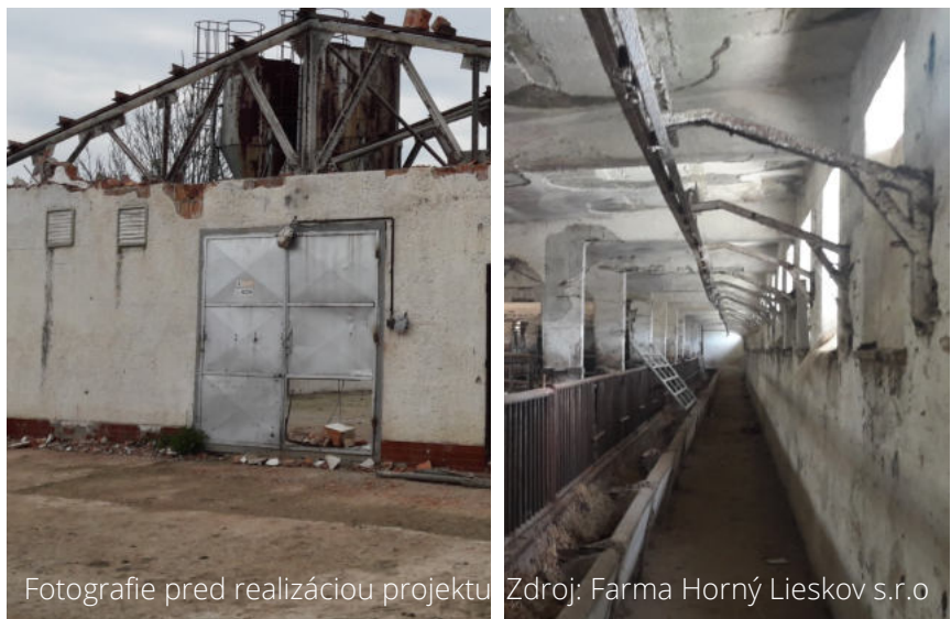
Fotografie pred realizáciou projektu