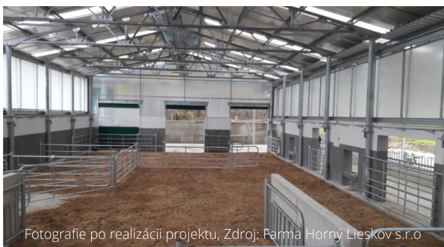
Fotografie po realizácii projektu, Zdroj: Farma Horný Lieskov s.r.o