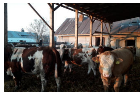
Fotografie po realizácii projektu