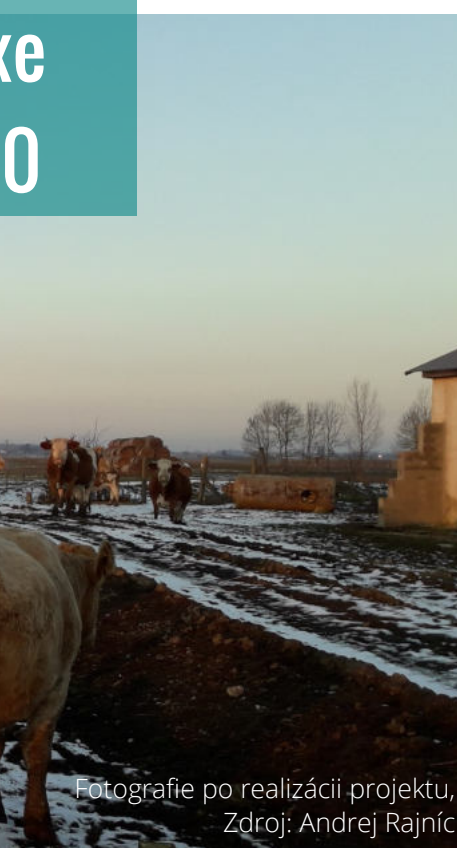
Fotografie po realizácii projektu, Zdroj: Andrej Rajnič