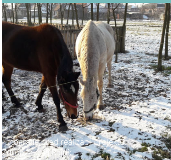
Fotografie pred realizáciou projektu

Schválená výška príspevku z PRV SR 2014 - 2020 : 50 000 €